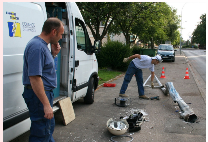
Accident de voiture sur un candélabre d'éclairage public, Route de Vitry

Nous continuerons nos efforts dans ce sens : aujourd'hui moins de 5% du réseau Basse-Tension sont aériens et devraient disparaître de notre paysage dans les toutes prochaines années.